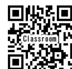
Google Classroom 登録の仕方の説明